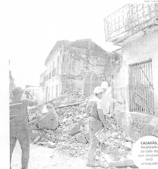
CASARÃO, localizado ao lado do que desabou, está ameaçado

"O mapeamento feito pelo Corpo de Bombeiros e realizado por meio da Defesa Civil Estadual, tem por objetivo, além de realizar o cadastro e manter os dados atualizados sobre cada imóvel, identificar os riscos e comentar, dentro dos órgãos competentes, a tomada de decisão, quer seja aionamento do proprietário, quer seja uma interdição, escoramento ou, ainda, a recuperação do imóvel", explicou o tenente Neiva. O Instituto do Patrimônio Histórico e Artístico Nacional (Iphan) é o responsável, nessas circunstâncias, por notificar o proprietário do bem acerca da necessidade de toma-